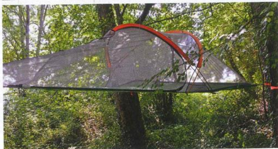
3. MODÈLES DE TENTE : le modèle livré qui est la tente Connect pour environ 499 € (la plus petite de la gamme), la Stingray pour environ 630 €, et la Trilogy pour environ 1 349 €.

“ Ma première pensée fut que cet accessoire se révélerait d'une parfaite utilité à la chasse. ”